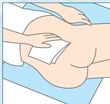
デリケートゾーンの清拭