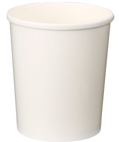
⑨ SI-1000T 白