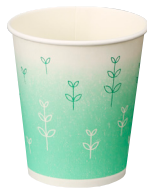
② 7オンスセブンスリーフ