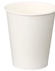
⑧ ホワイトカップ H-500