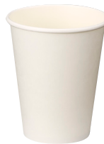
⑦ 8オンススノーホワイト厚紙