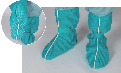
アルファシューズカバー セミロング