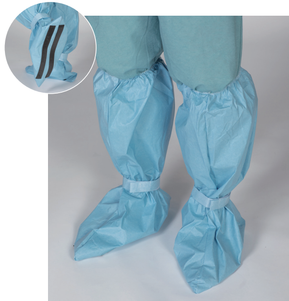
シューカバー・ロングII