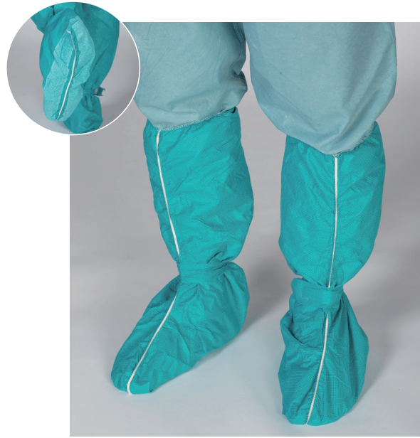
アルファシューズカバー ロング