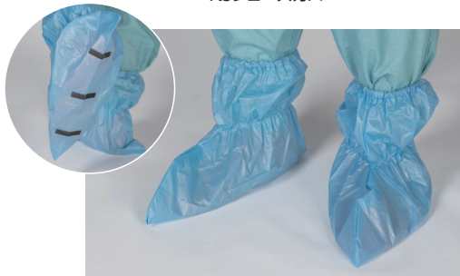
シューカバー (ショート)